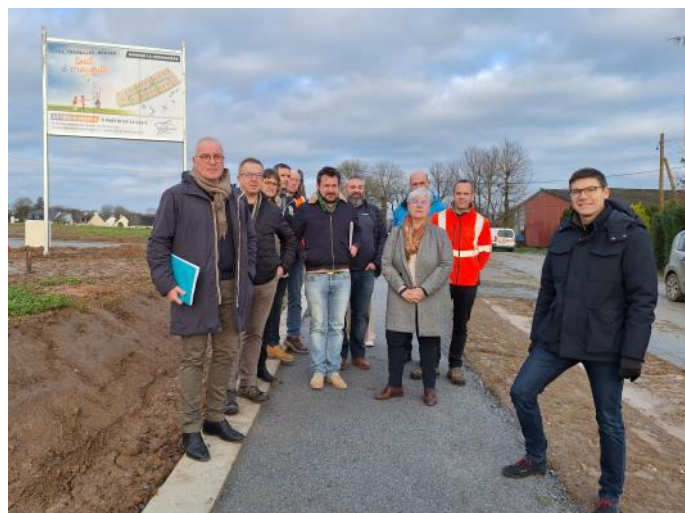
Réception des panneaux promotionnels des hameaux de Merdrignac—Ici à la Héronnière ▶