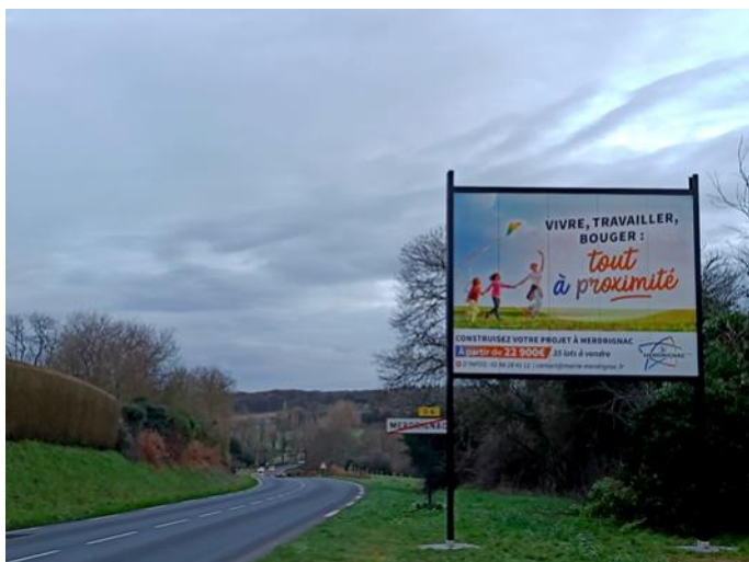
◀ Panneau d'entrée et sortie de ville, route de Saint-Vran