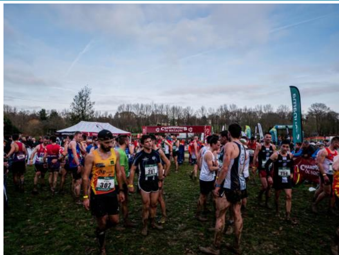
▲ Le Cross Régional de Bretagne accueilli au Val de Landrouët et organisé par L'Athlétisme Sud 22