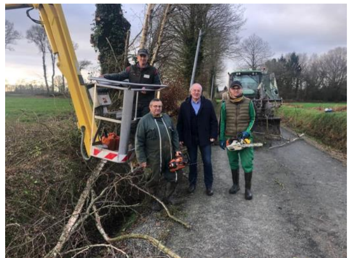
▲ Les opérations élagages se poursuivent pour accueillir l'arrivée de la fibre optique.