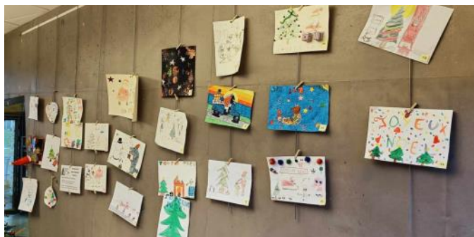
▲ Bravo et merci à tous les jeunes participants du concours « Noël en Folie »

Jusqu'au 26 février « Photos du coin et de plus loin »