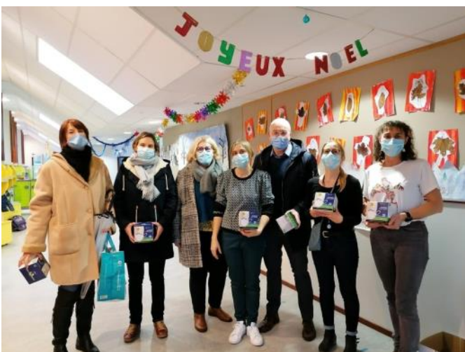
▲ Distribution de masques FFP2 aux équipes enseignantes des écoles primaires de Merdrignac.