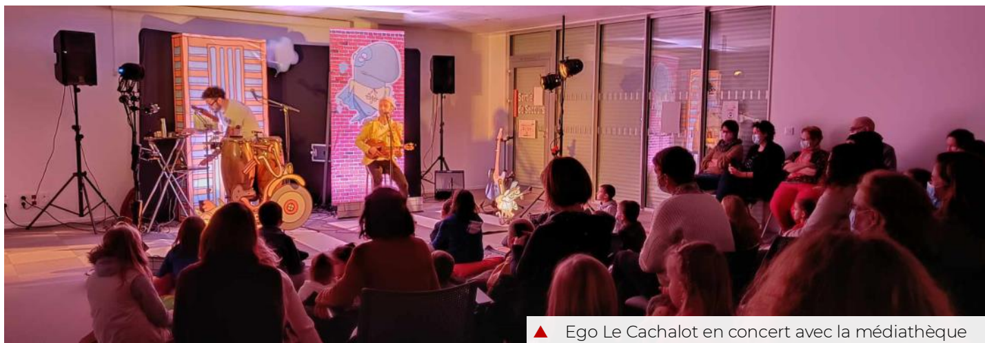
▲ Ego Le Cachalot en concert avec la médiathèque