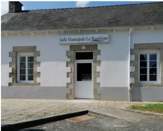
Nouvelle façade pour la Salle de la Madeleine

Pour tous les dossiers en cours ou aboutis, les réunions de travail ont été complexes à mettre en place, et nous n'avons pas toujours pu réunir les prestataires et partenaires comme nous le souhaitions.