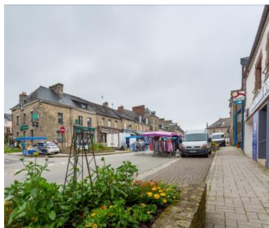
Le centre-bourg - Jour de Marché

Enfin, nos services publics sont restés ouverts dans la mesure du possible, nous nous sommes adaptés. Les animations de la médiathèque reprennent, que ce soit en accueil de public ou en accueil de classe. Les ateliers numériques ont repris également. Notre personnel a fait preuve d'adaptation et je les en remercie.