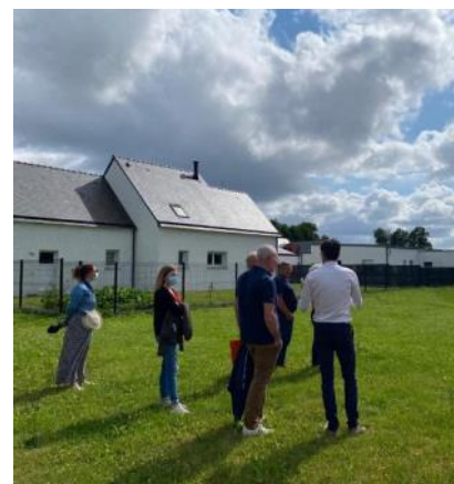
Visite des nouvelles zones d'habitat de Pontivy et Kerfourn.