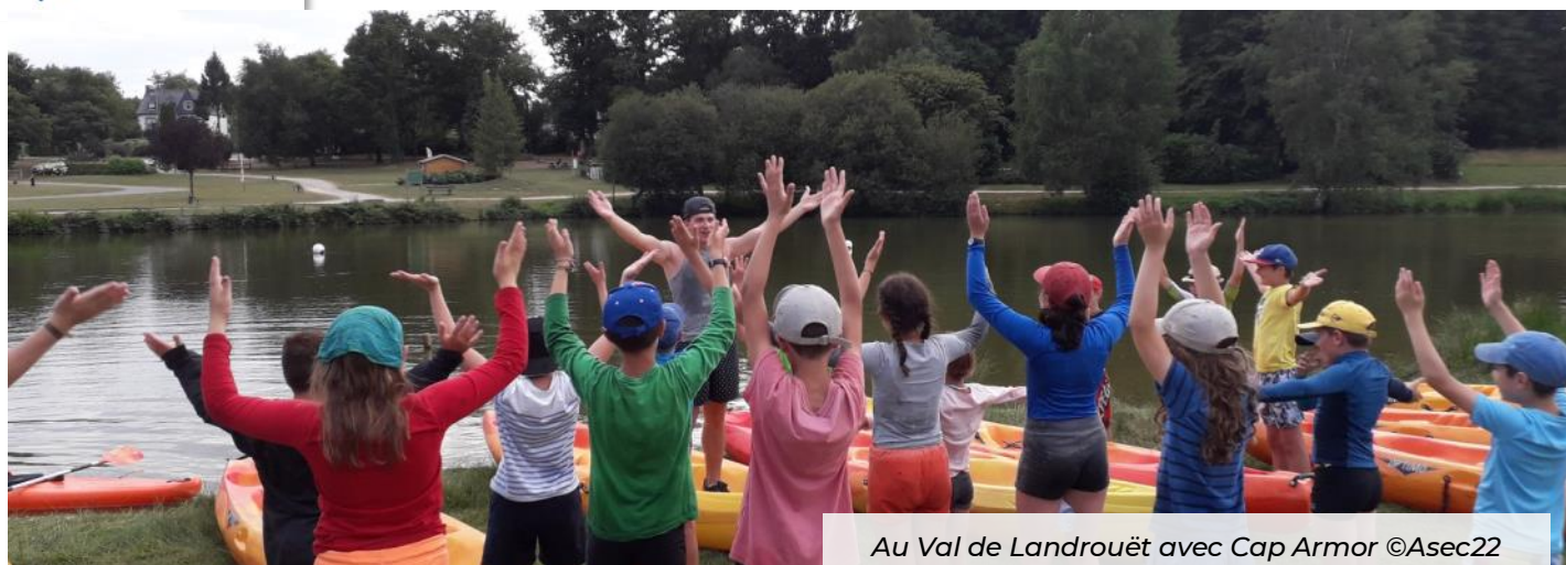
Au Val de Landrouët avec Cap Armor